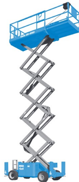
Abb. nur zu Illustrationszwecken. CE Maschinen sind mit Scherenschutz-Paket ausgestattet.