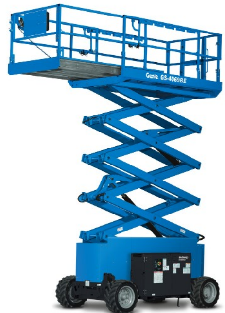
08/17 Ersatzteil Nr. B127304DE